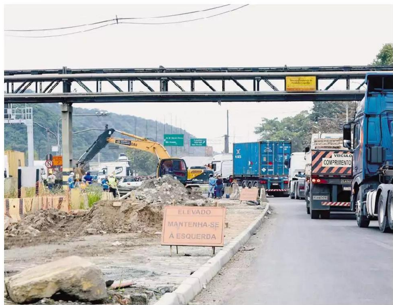
Obras, que incluem troca de pavimento, visam dar mais fluidez ao principal acesso ao Porto de Santos