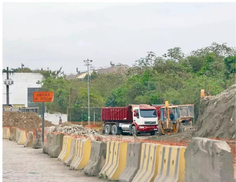
Trabalhos são executados pelo Consórcio Fmeng-Alemoa, contratado por R$ 27,8 milhões pela APS