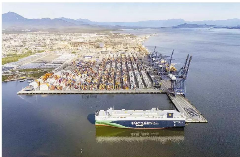
Resultado elevou participação do porto paranaense para 14,71% das importações e exportações do Brasil