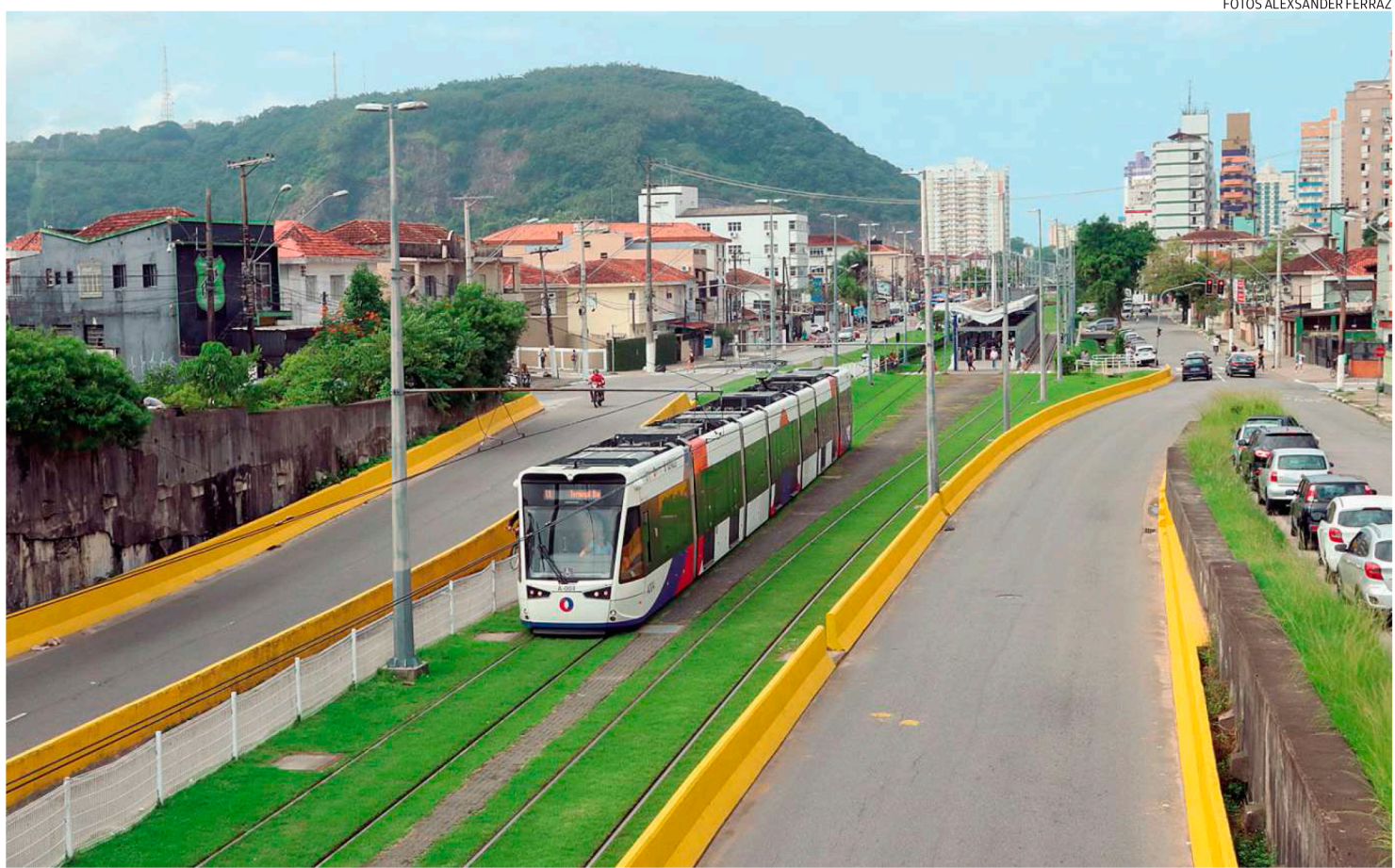
Governo de SP liberou EMTU para contratar um projeto executivo que vai definir o traçado e custos para uma possível ampliação do serviço

Atualmente, o VLT conta com 11,1 km de extensão,