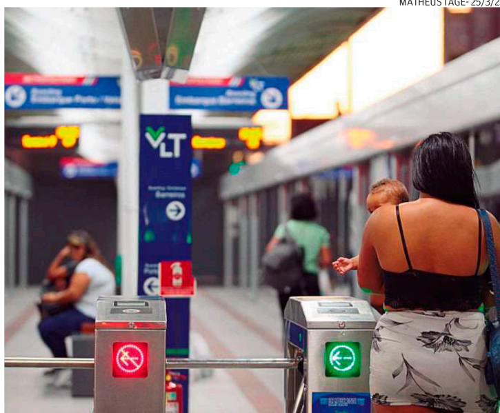
As obras da terceira fase, em São Vicente, devem começar este ano

com percurso entre os terminais Barreiros, em São Vicente, e Porto, em Santos. As obras para ampliação estão na segunda fase, que tem como foco o Centro santista. O trajeto será entre as estações Conselheiro Nébias e Valongo.