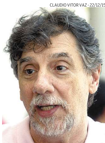
Obeidi indica comprar na Cidade