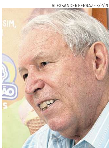
Antoneli cita saque extra do FGTS