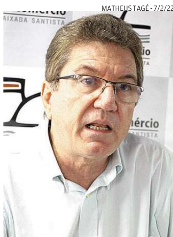
Isso ameniza a inflação, diz Assaf

Aqueles que começaram a receber o benefício depois de janeiro deste ano terão o valor do 13º salário calculado