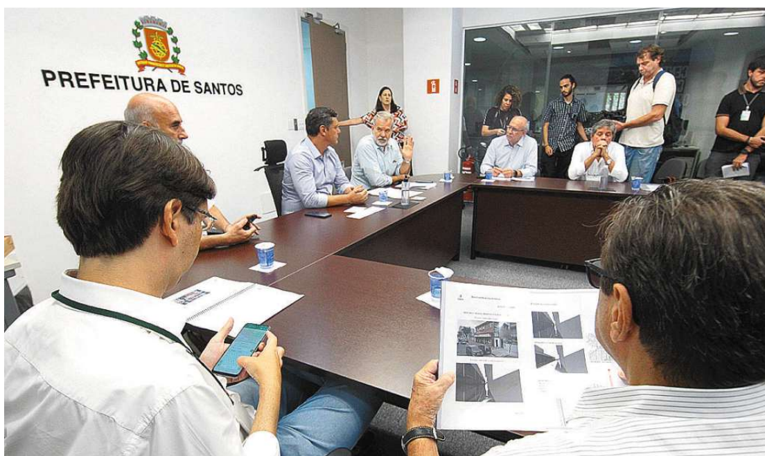
Assunto foi discutido em reunião, ontem, no Paço Municipal. Novo encontro para debate de datas será hoje

“É uma região que teve várias modificações. É uma infraestrutura já instalada e antiga. Uma obra de mobilidade urbana, mas que envolve uma boa etapa de drenagem. Uma parte estará finalizada no fim do ano”, disse o prefeito santista.