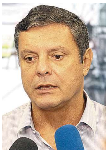
Prefeito menciona drenagem