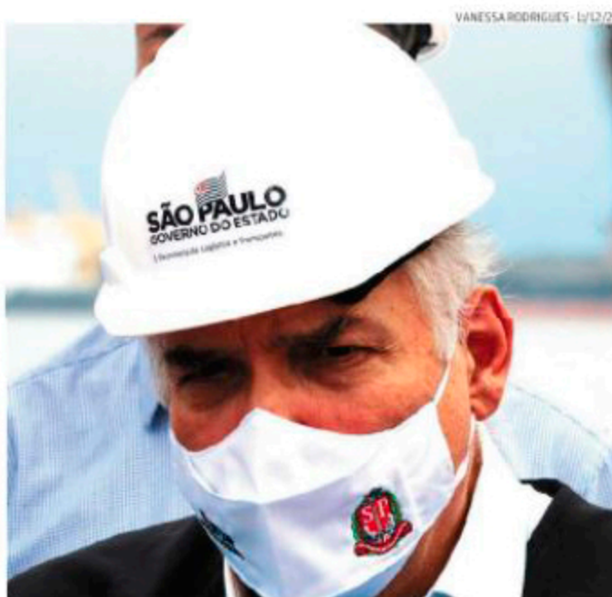
Octaviano calcula que operação particular começará no 2º semestre