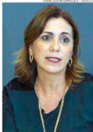
Deputada: estímulo à economia

Os outros terminais incluídos no edital ficam em Aracaju (SE), Manaus (AM), Belém (PA), Natal (RN) e Vitória (ES).