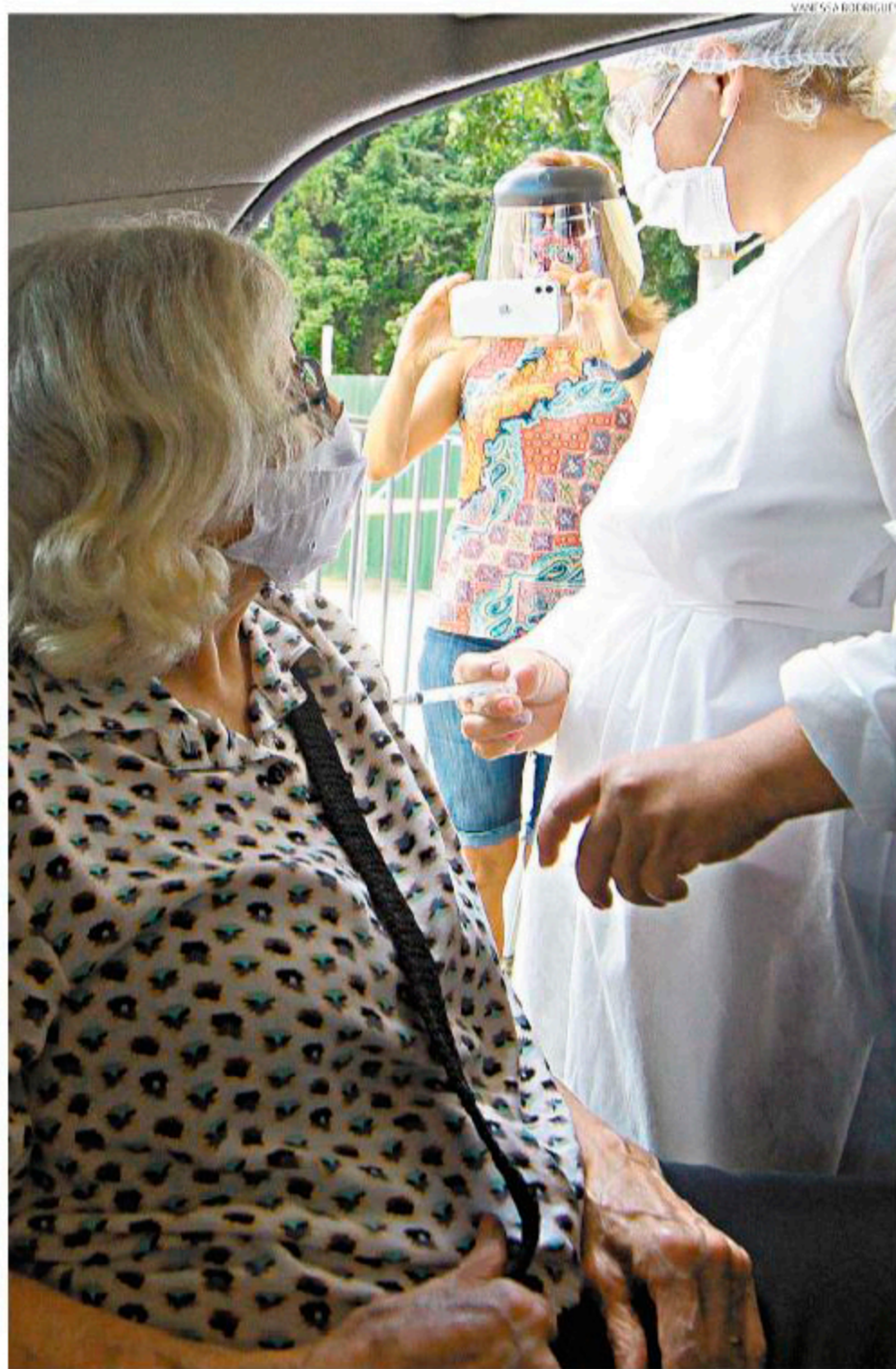
Em Santos, ontem, foram aplicadas 4.450 doses em 30 locais, incluindo o drive thru na Arena Santos