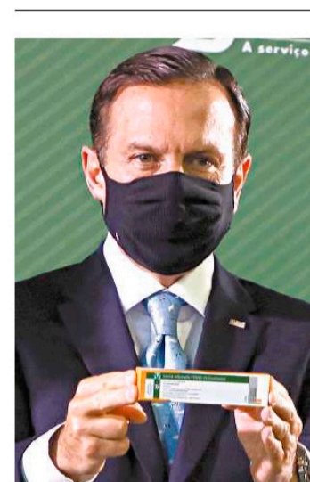
Dória: foi um “dia histórico”

Pelo calendário atual de vacinação do Governo do Estado, o intervalo entre a aplicação da primeira e segunda dose é de 21 dias (três semanas).