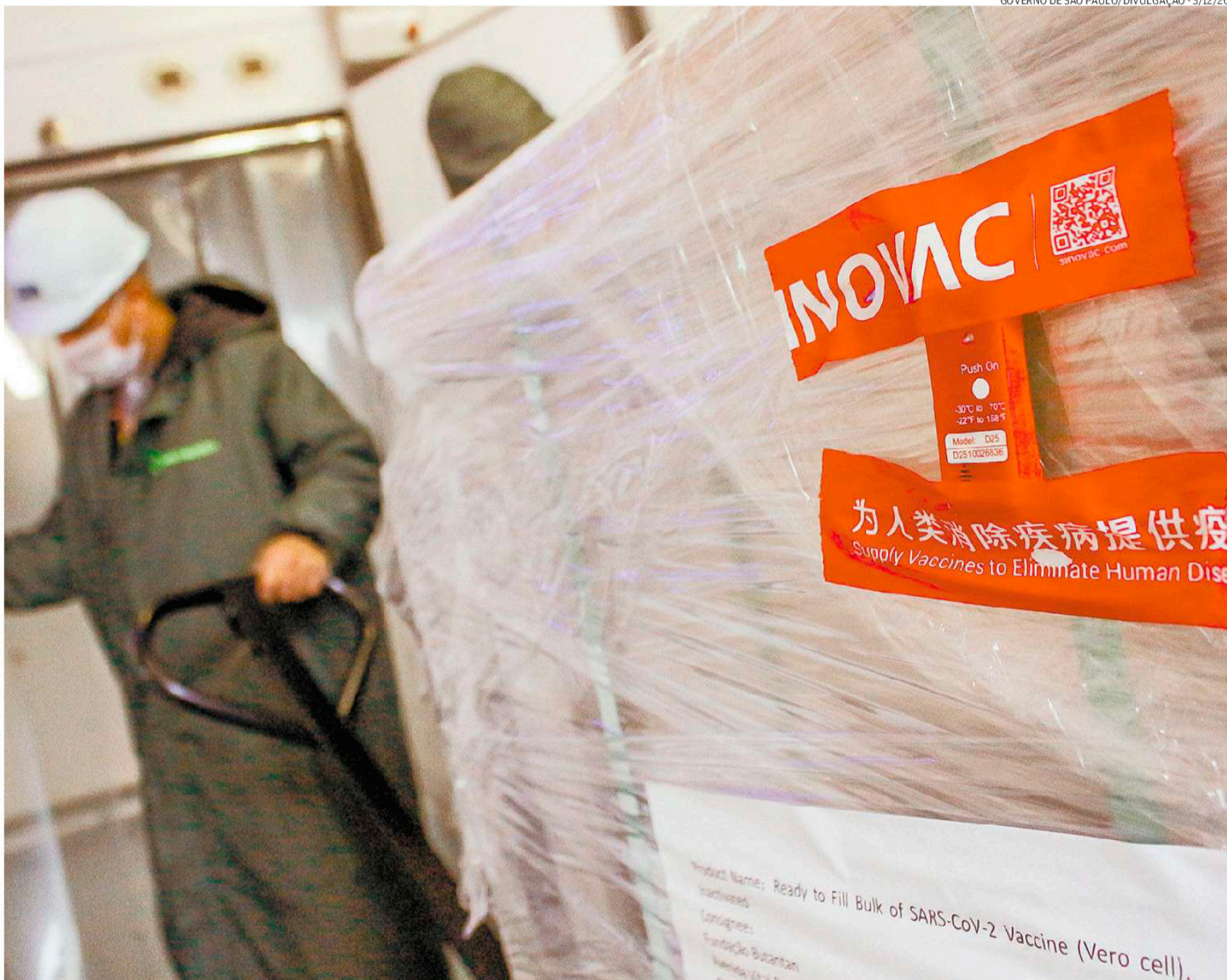
Nos últimos meses, Instituto Butantan recebeu em São Paulo lotes com milhões de doses da CoronaVac; material foi enviado pela farmacêutica chinesa Sinovac