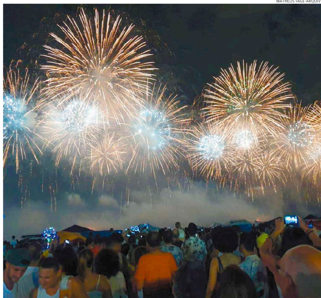
Depois do cancelamento dos fogos, Prefeitura proíbe barracas, cadeiras e ambulantes na areia