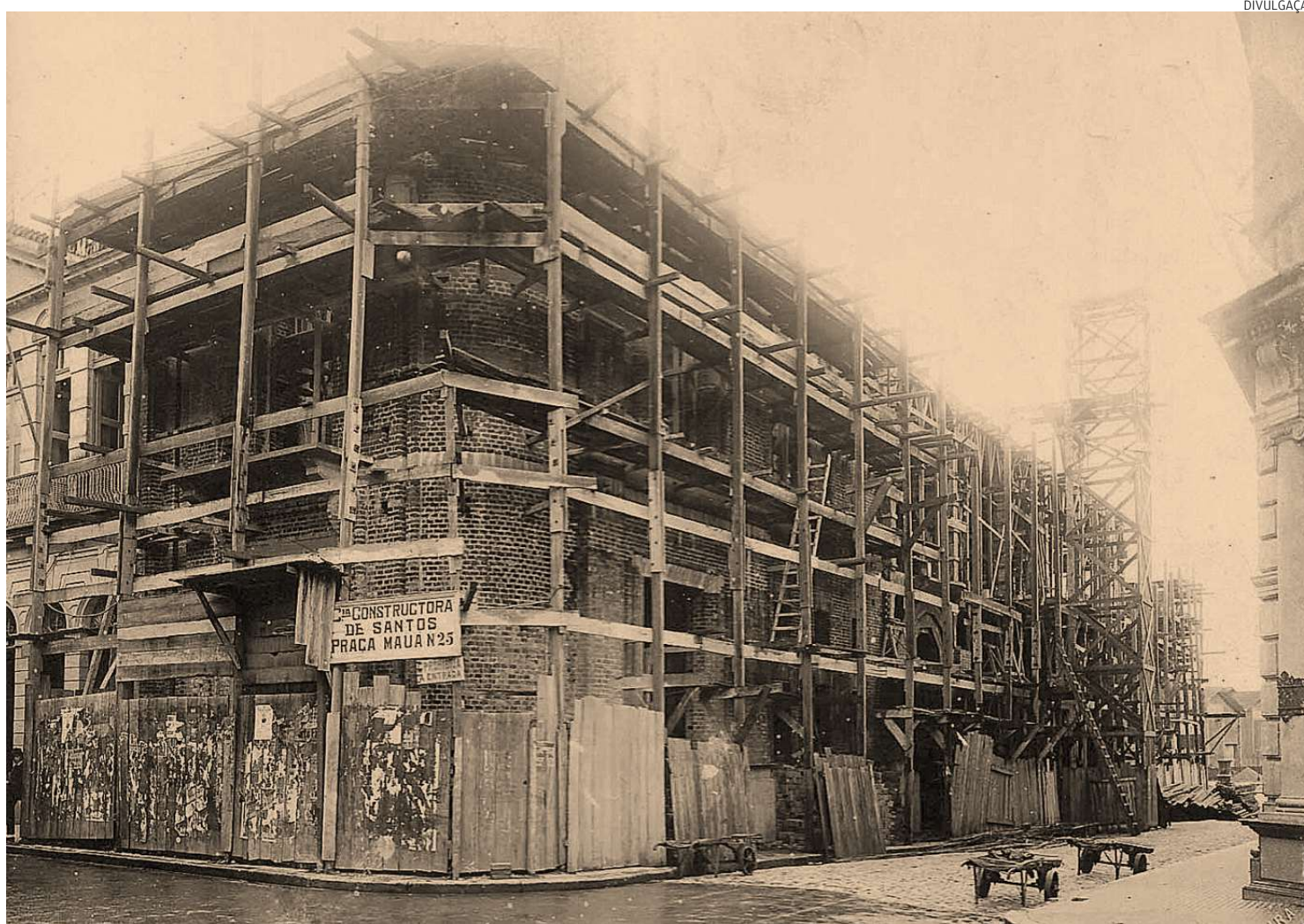
O prédio histórico, sede da Associação, na Rua XV de Novembro, ainda em construção: o prédio foi inaugurado em 1924

Segundo ele, o projeto-piloto surgiu a partir da necessidade de empresários lo-