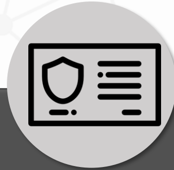
Autoridade Nacional De Proteção de Dados Pessoais – ANPD