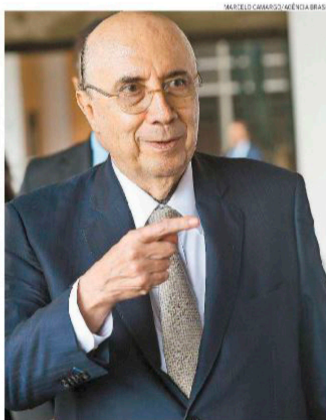
Meirelles promete desburocratização em questões tributárias