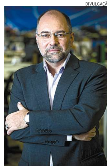
Ricardo se preocupa com cenário

Apesar dos esforços para mitigar os efeitos de suspensão das aulas, o problema estrutural de desigualdade fica ainda mais em evidência, afirma Henriques, ex-secretário executivo do Ministério de Assistência Social, em 2003 e 2004, quando coordenou o desenho do programa Bolsa Família e também atuou como secretário nacional de Educação Continuada, Alfabetização, Diversidade e Inclusão no Ministério da Educação.