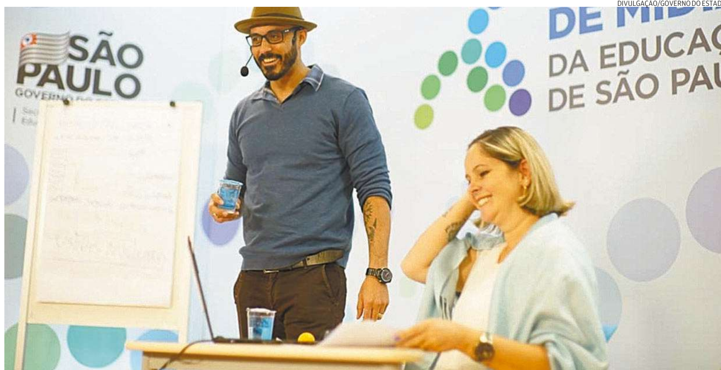
Na rede estadual, a pandemia de covid-19 fez com que as aulas passassem a ser gravadas no Centro de Mídias e transmitidas pela TV e internet

“Muitos terão que trabalhar para ajudar a complementar a renda de casa, seja devido ao desemprego ou pela situação de adoecimento de parentes. O empobrecimento das famílias tenderá a aumentar a migração de estudantes de escolas pri-