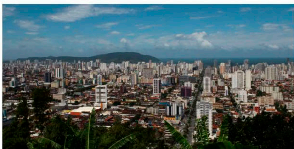
Comércios na cidade voltam a funcionar na quinta-feira (11)

Nathália de Alcantara Da Redação 06.06.20 9h25