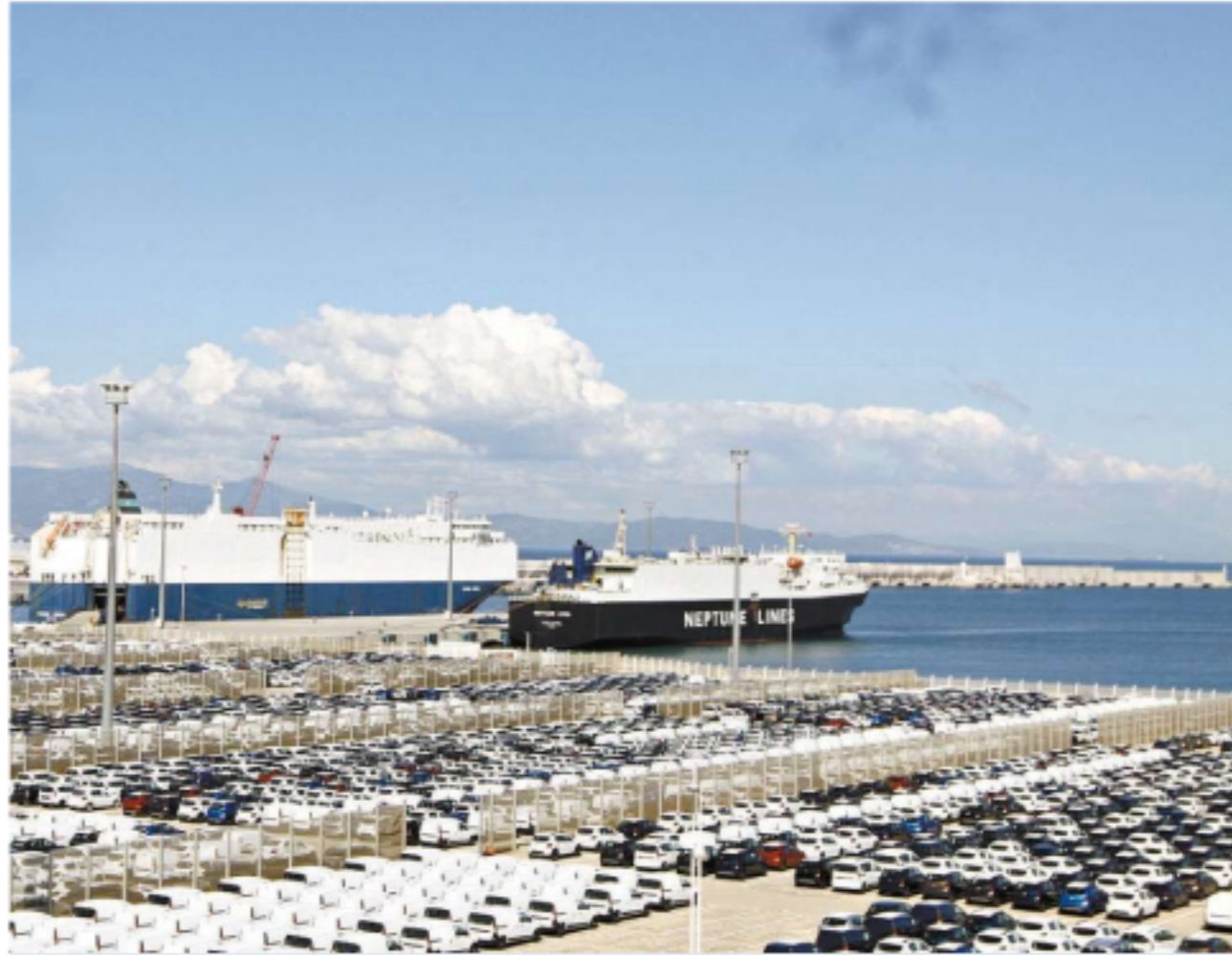
Complexo portuário se destaca como o grande hub port , além de operar veículos e hidrocarbonetos

O setor de contêineres é seu carro-chefe. Tanger Med conta com dois terminais especializados nessas cargas, ambos com 400 mil metros quadrados de área, 800 metros de cais linear e berços com 18 metros de profundidade. Juntos, operaram no ano passado 3,31 milhões de TEU (unidade equivalente a um contêiner de 20 pés), um aumento de 12% sobre o ano anterior, que também fechou em alta. O crescimento também se verifica nas escalas de meganavios (aqueles com mais de 299 metros e que demandam mais de 15 metros de profundidade para operar plenamente), que subiram 17%, segundo dados da Autoridade Portuária.