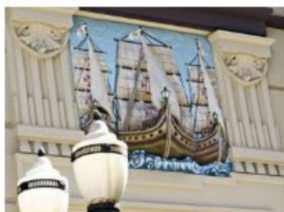
Restauração revela detalhes arquitetônicos e decorativos comuns no período áureo do café em Santos