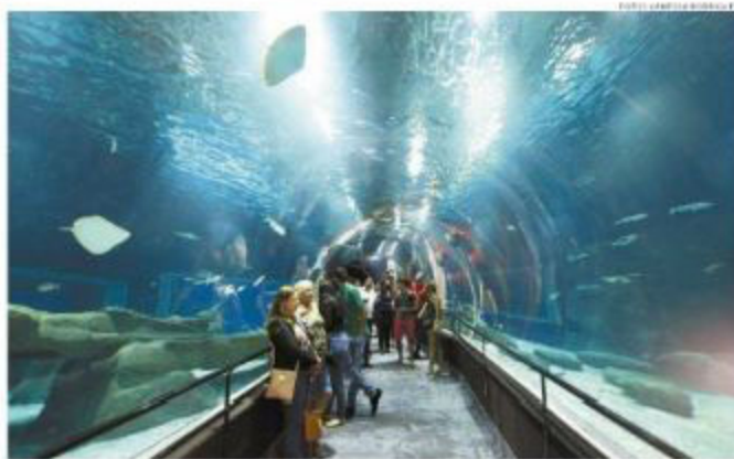
Denominado AquaRio, equipamento é um dos mais visitados do Porto Maravilha: investiram-se R$ 150 mil

O Ficon é uma iniciativa do Grupo Tribuna, com organização da Una Marketing de Eventos e tem o patrocínio da Associação Comercial de Santos, Associação dos Empresários da Construção Civil (Assecob), Grupo Mendes, Grupo Macuco, Mourão Construtora e Incorporadora, Serviço Social da Construção (Secconci), Sindicato da Habitação (Secovi), Sindicato da Construção (Sinduscon) e Vértice Construtora.