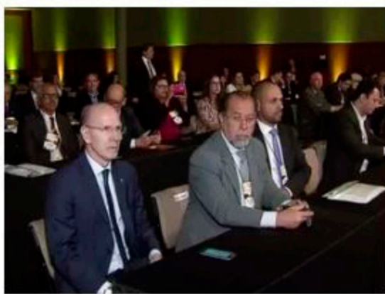
Santos Export reúne autoridades do setor

O vice-governador e ex-prefeito de São Vicente, Márcio França (PSB), esteve no evento. “É o mais importante fórum dessa área no Brasil e tem uma dimensão nacional. Em especial, neste momento, temos que debater a entrada e a saída da cidade, problemas de ressaca e enchentes”, falou.