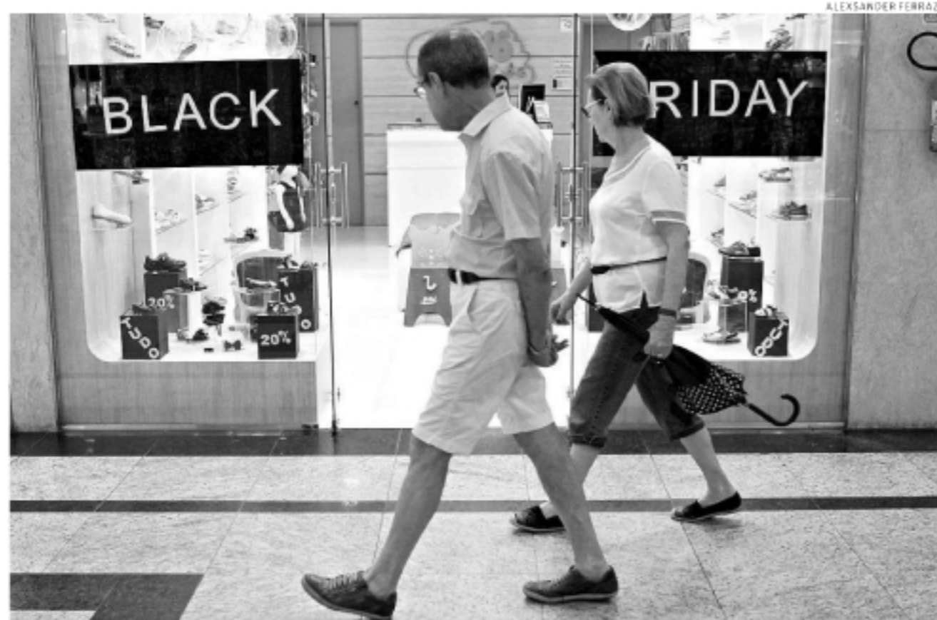
O Praiamar Shopping participa da campanha e teve adesão de mais de 50 lojas, com descontos de até 70%