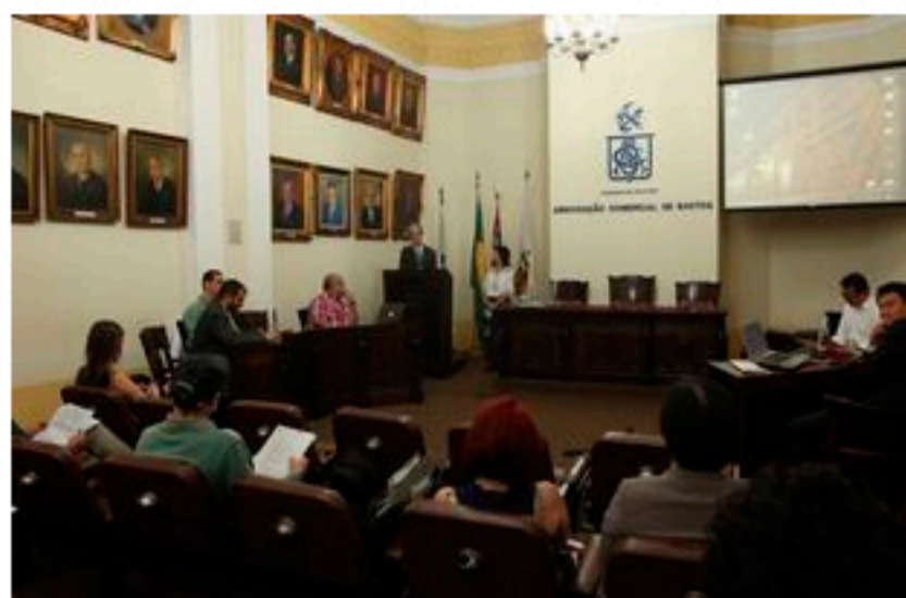
A pesquisa foi apresentada na Associação Comercial de Santos

Santos é a única cidade da América Latina incluída em estudo detalhado sobre a elevação do nível do mar até 2100. A pesquisa, denominada Projeto Metropole, envolve cientistas brasileiros e estrangeiros na análise e projeção desse aumento.