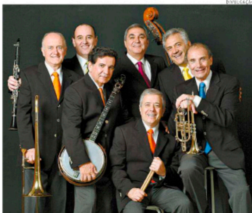
A Traditional Jazz Band faz a última apresentação de sábado

ra, 17h) Abbey Road, banda cover dos Beatles (sexta-feira, às 19h), roda de samba Ouro Verde (sábado, às 13h) e a Traditional Jazz Band (sábado, às 19h).