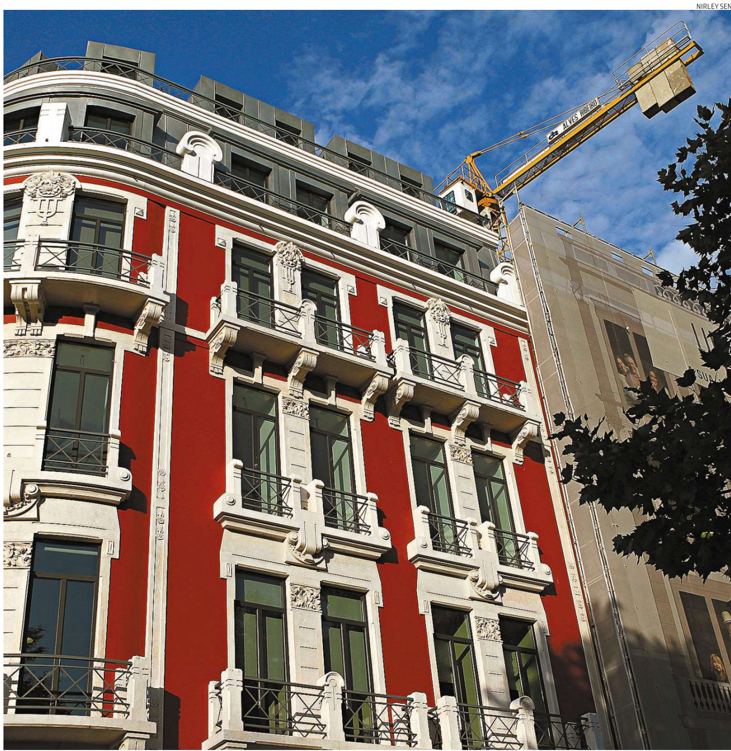
Em estilo retrofit (restauro que dá utilidade econômica a prédios antigos), Edifício Cartier é um dos projetos em destaque na capital portuguesa

Atraso ou extravio de mercadorias, via Correios, costuma gerar mais do que dor de cabeça. Em algumas situações, prejuízos também, com perda de prazos e insatisfação de clientes. A empresa diz que situações como essas representam 0,1% das reclamações. Para o Instituto Brasileiro de Defesa do Consumidor (Idec), porém, segurança e responsabilidade são obrigações dos Correios. A-7