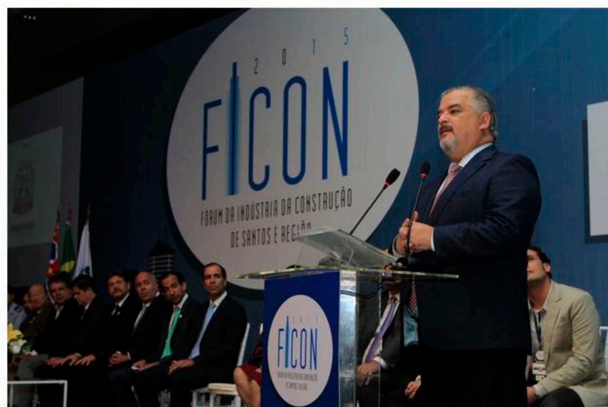
Vice-governador Márcio França esteve presente na abertura do Ficon nesta terça-feira