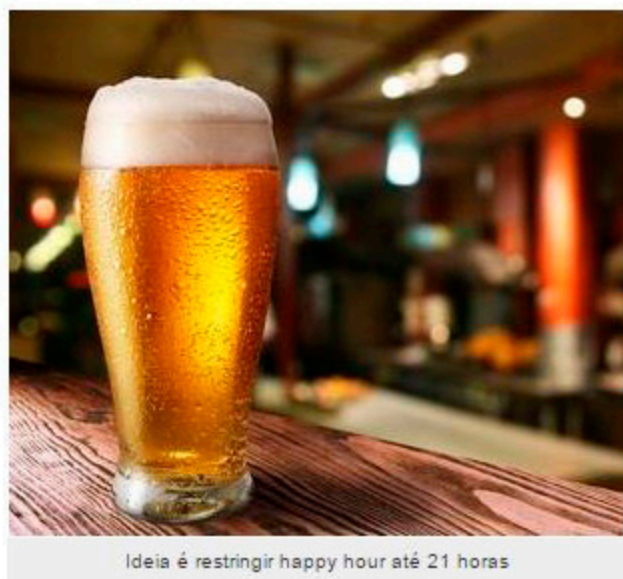
Ideia é restringir happy hour até 21 horas