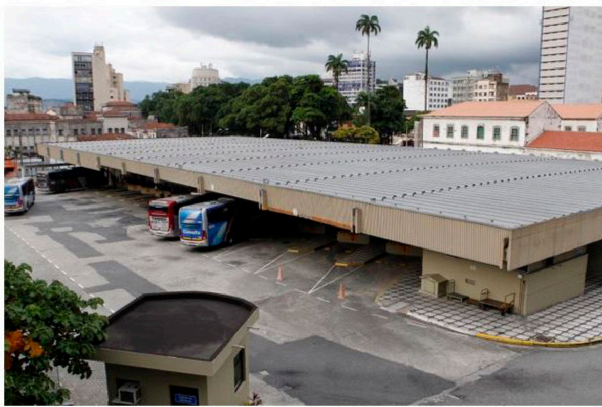
Um dos projetos prioritários das Parcerias Público-Privadas será a modernização da Rodoviária de Santos

Contratada pela Prefeitura, a Fundação Instituto de Pesquisas Econômica (Fipe) prestará consultoria para elaborar estudo de viabilidade dos projetos. Não há estimativa de quanto será o aporte financeiro dos parceiros privados em cada projeto. Os editais de licitação estão previstos para serem lançados em 2016.