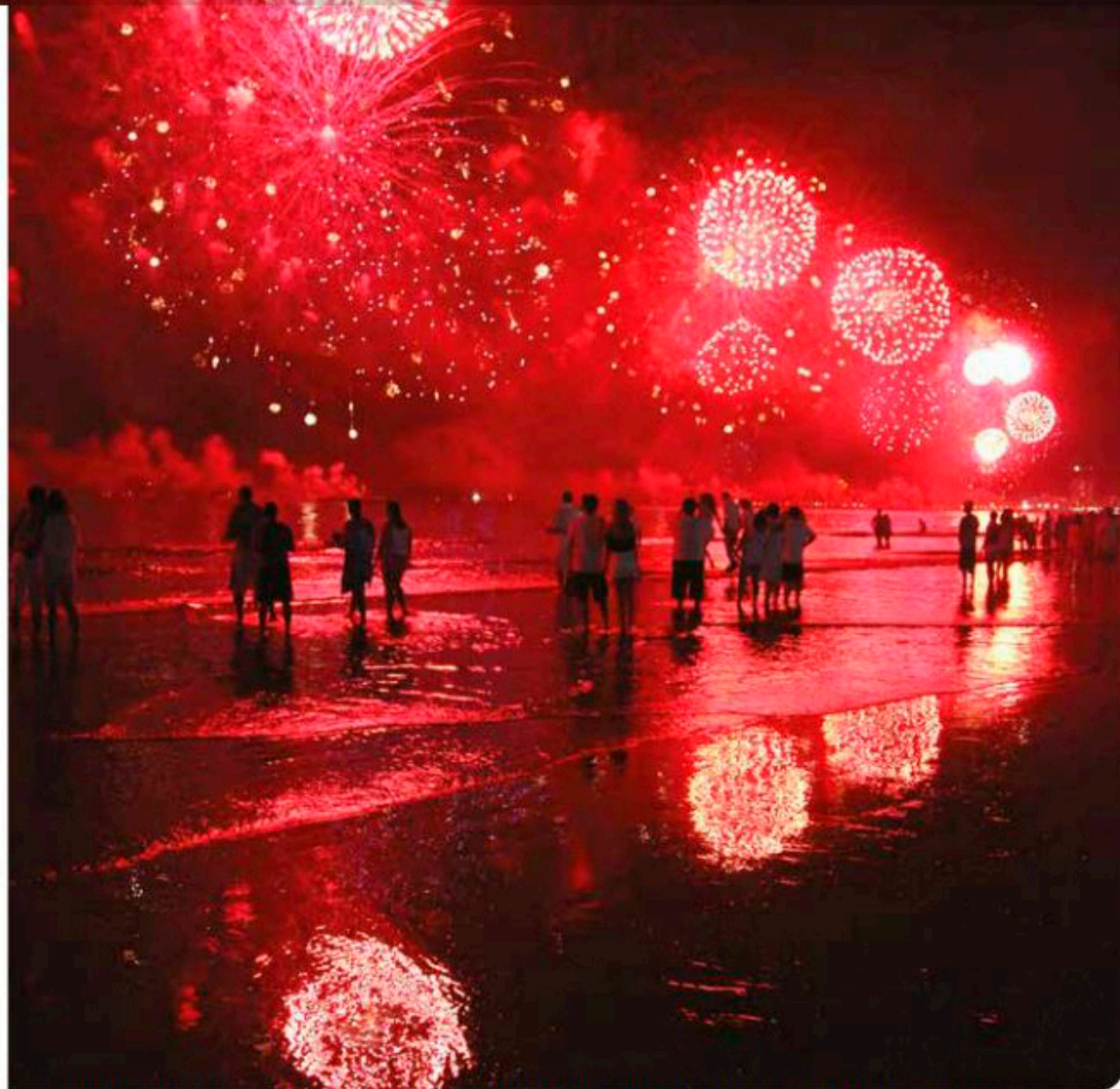
Espectáculo contará com 19 toneladas de fogos, 10 balsas no mar e duração de aproximadamente 16 minutos

cionarão das 10h às 13h e das 14h às 16h, com agenda diversificada nas barracas 1 e 4. A 2 terá Espaço