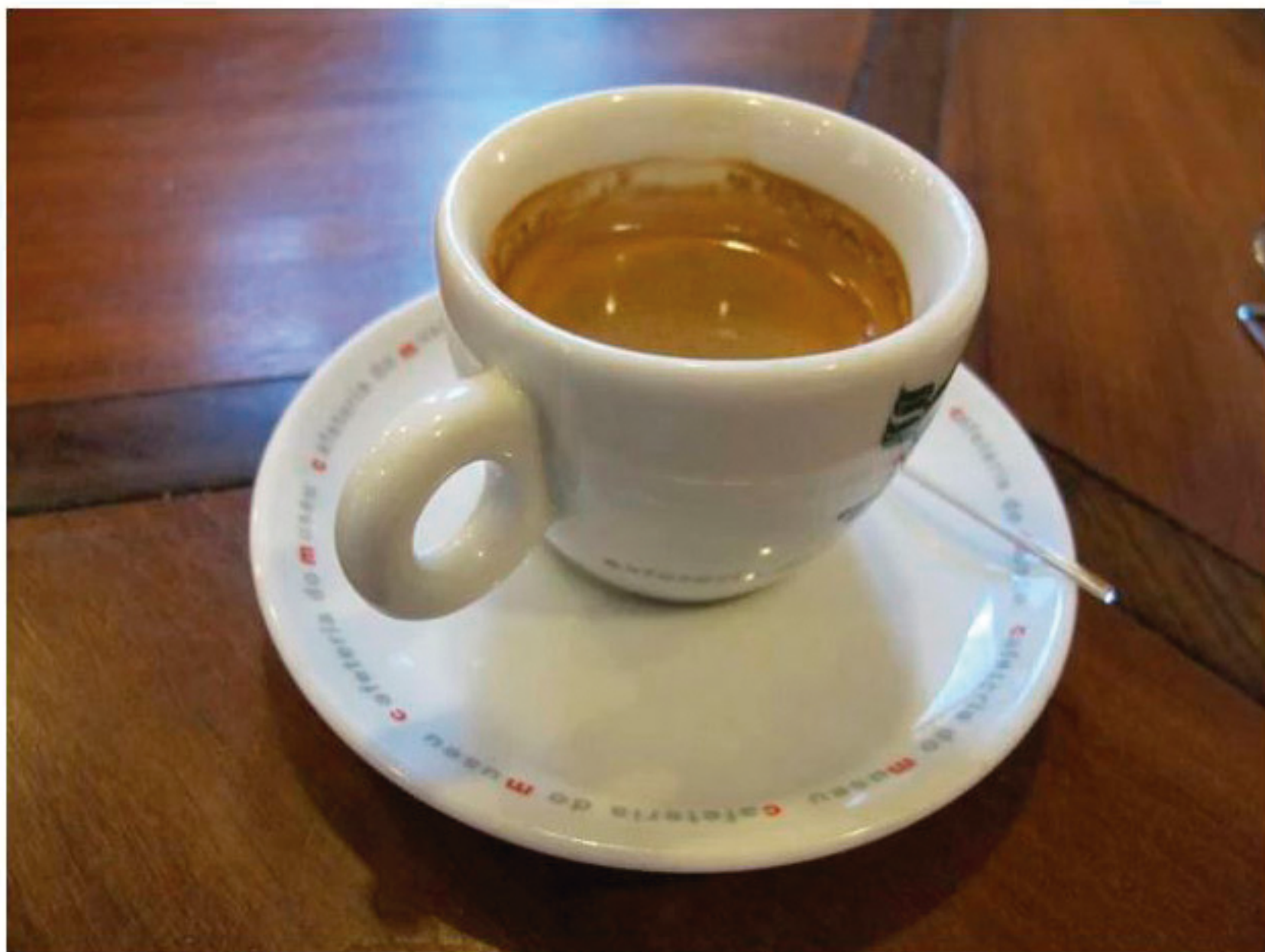
Desgustadores de café receberam certificados em Santos, SP