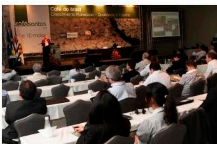
Seminário ocorre na quarta e quinta-feira

Começa nesta quarta-feira, em Guarujá, o 20º Seminário Internacional do Café. O evento, organizado pela Associação Comercial de Santos (ACS), tem mais de 320 inscritos, representando 14 países, e contará com a presença do governador Geraldo Alckmin (PSDB). O seminário continua amanhã no Sofitel Jequitimar. Trata-se do mais importante encontro do setor cafeeiro do Brasil.