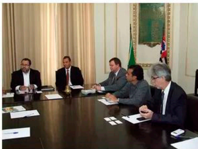
Encontro reuniu representantes de portos

Dois representantes do Porto de Houston, nos Estados Unidos da América, visitaram a Associação Comercial de Santos, no litoral de São Paulo. Eles se reuniram com diretores da ACS e debateram a possibilidade de criar oportunidades de comércio entre os portos de Santos e da América do Norte.