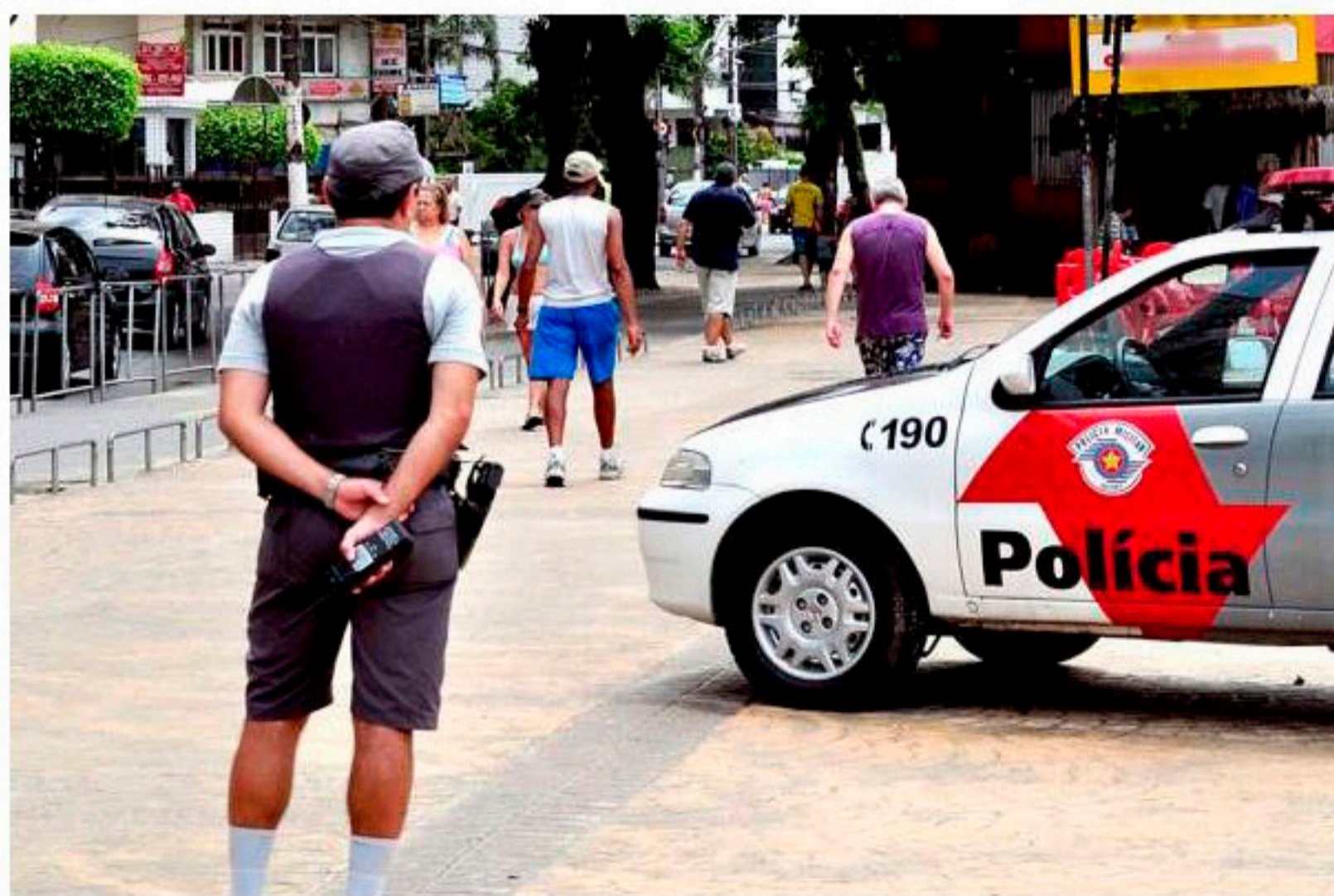
O reforço do efetivo da Polícia Militar para a Operação Verão chegará a Santos no próximo dia 26 de dezembro

O secretário também afirmou que a Guarda Municipal está orientada para atuar nas pequenas infrações, como esportes praticados fora de local e hora apropriados e crianças perdidas. "A GM trabalhará com motos, bicicletas, patinetes elétricos, a pé e de quadriciclo na faixa arenosa".