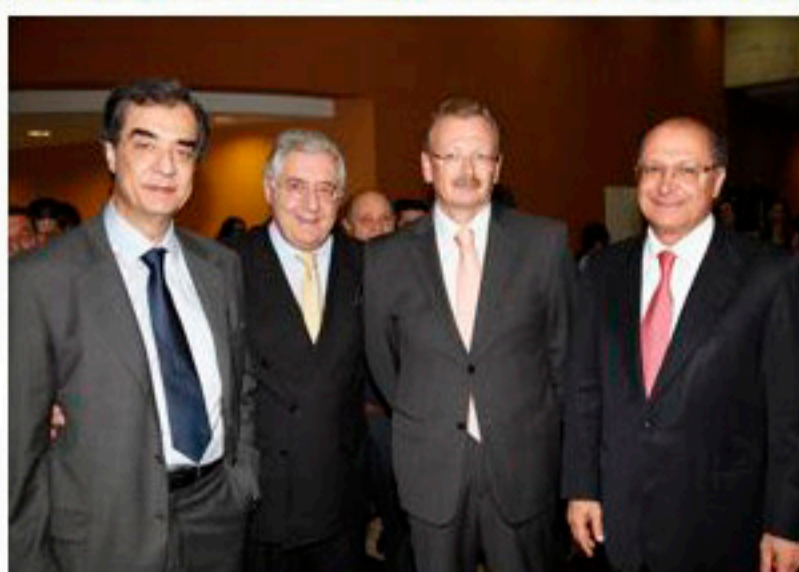
Dirigentes da Facesp

Com o tema Hora de Agir, o 12º Congresso da Federação das Associações Comerciais do Estado de São Paulo (Facesp), iniciado ontem à noite, em Santos, litoral paulista, marca a renovação da coesão entre as 420 associações comerciais de São Paulo em torno da defesa do empreendedor e do empreendedorismo brasileiro. Também estabelece o início de uma nova era no gerenciamento de informações das associações comerciais depois da criação da Boa Vista Serviços (BVS), administradora do Serviço Central de Proteção ao Crédito (SCPC), que participa pela primeira vez do congresso. A BVS é empresa da Associação Comercial de São Paulo (ACSP), que publica este Diário do Comércio.