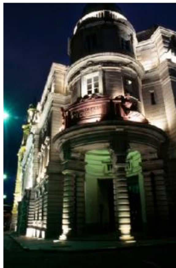
Museu do Café em Santos

O Museu do Café, instituição da Secretaria de Estado da Cultura, está com inscrições abertas para o programa "Guia Amigo do Café". A iniciativa, que conta com apoio da Secretaria Municipal de Turismo, tem como objetivo atualizar os profissionais da área com informações sobre o mercado de café e sua relação indissociável com a cidade, permitindo a criação de um novo roteiro pelo Centro Histórico de Santos focado no café. A aula inaugural acontece no dia 11 de abril, às 9h. As inscrições são gratuitas, restritas a 30 participantes, e devem ser feitas pelo telefone (13) 3213-1750.