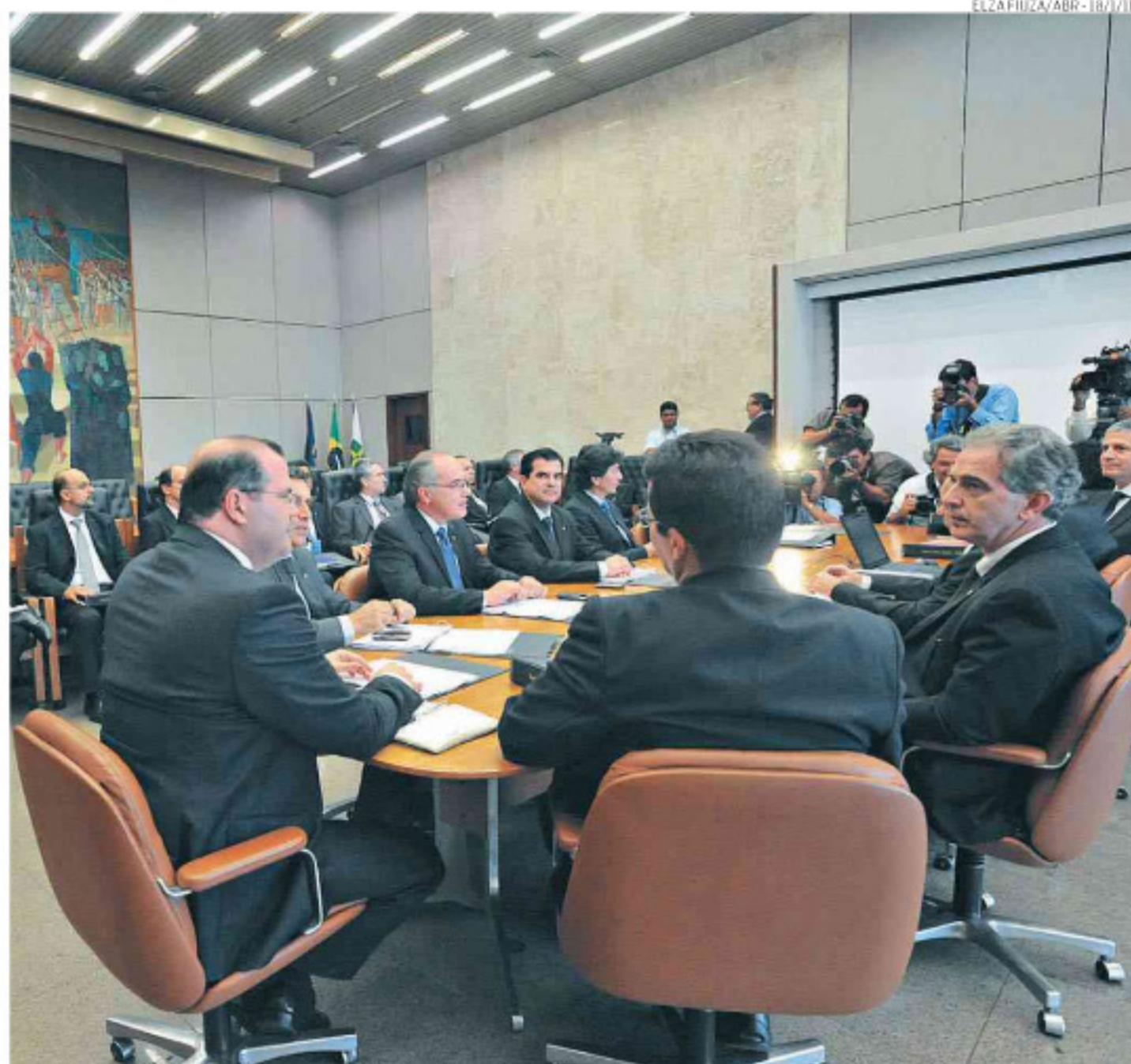
Reunião do Copom realizada em janeiro, a primeira sob o comando de Tombini: controle da inflação