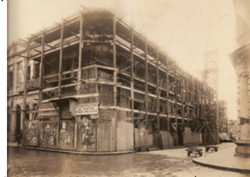
Imagem 75: Fachada da Associação Comercial de Santos em construção, totalmente coberta por andaimes.